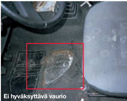
Ei hyväksyttävä vaurio