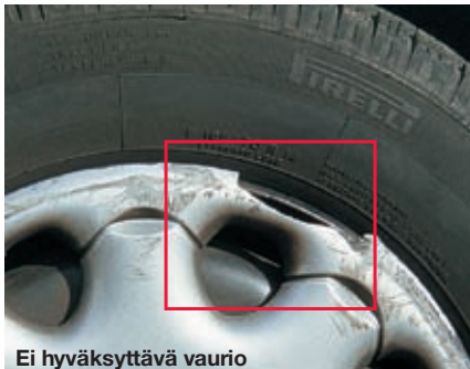
Ei hyväksyttävä vaurio