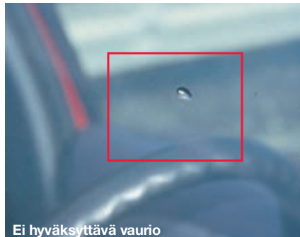
Ei hyväksyttävä vaurio