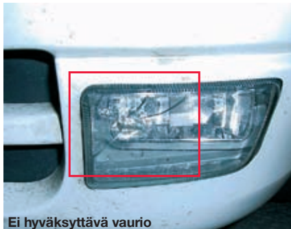
Ei hyväksyttävä vaurio