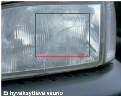
Ei hyväksyttävä vaurio