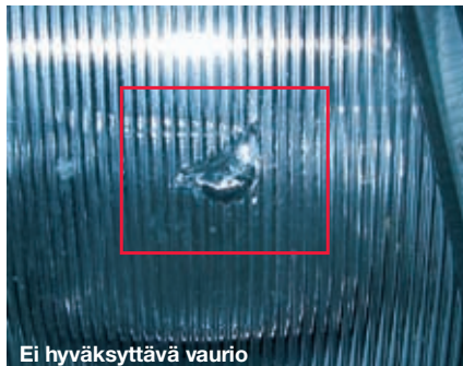
Ei hyväksyttävä vaurio