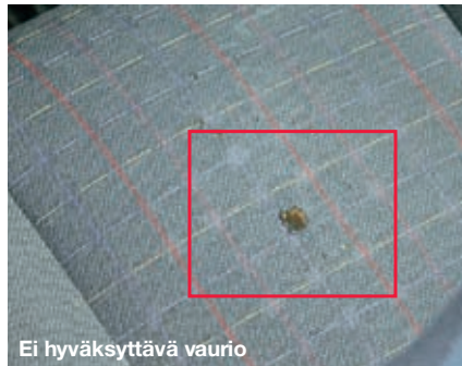
Ei hyväksyttävä vaurio