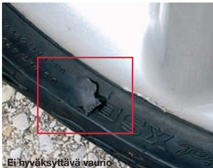
Ei hyväksyttävä vaurio